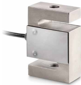
FS SP1 Per prove precise di trazione e compressione

Set di misuratori di forza SAUTER FS SP1 · FS RY1 · FS RQ1 · FS OY1 · FS OY2